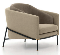
7 FIL NOIR POLTRONA CM 79X84 H75